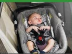
Автокресло «лялька» группы 0 (для детей массой < 10 кг)*

При покупке детского удерживающего устройства обязательно следует уточнить у продавца наличие сертификата на товар!