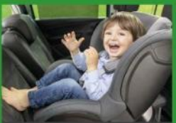
Автокресла групп I (для детей массой 9-18 кг)*